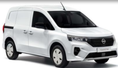
QNG White (bez příplatku)