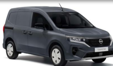
KPW Šedá Urban (5 785 Kč bez DPH)